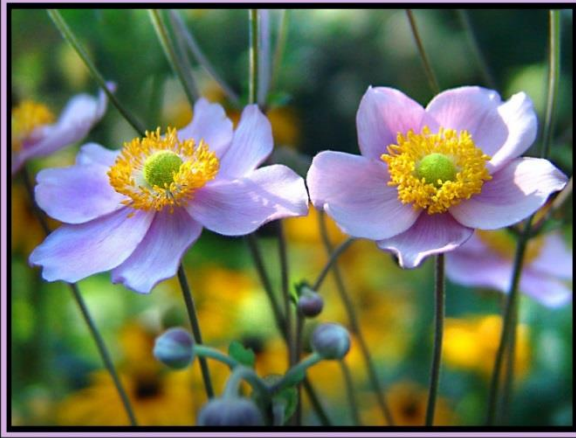
ليکنه او ټولونه: ميرزا علم حميدي ترتيب کوونکی: انجنير عبدالقادر مسعود