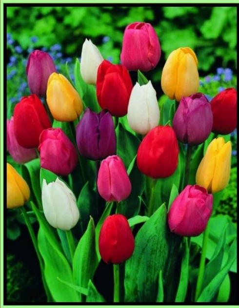
لیکنه او ټولونه: ارواښاد مرزا علم حمیدي ترتیب کوونکی: انجنیر عبدالقادر مسعود