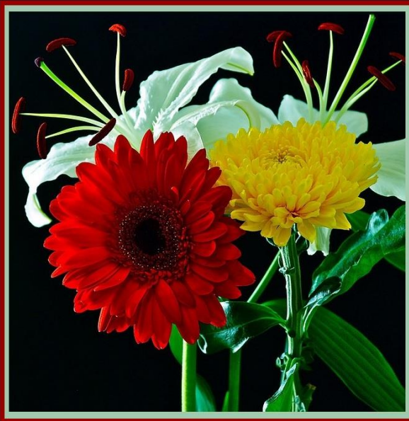
لیکنه او ټولونه: ارواښاد مرزا علم حمیدي ترتیب کوونکی: انجنیر عبدالقادر مسعود

* ته خپلو ښیګڼو ته دوام ورکړه، نور به هم ښه شي ځکه د ښو خلکو بدن د باد او د بدو خلکو بدن د وښو په شان دی کله چې باد الوزي وایښه مجبور دي چې خپل سرونه ټیټ کړي.