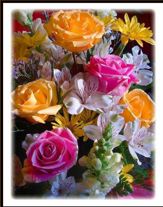
ترتیب کوونکی: انجنیر عبدالقادر مسعود