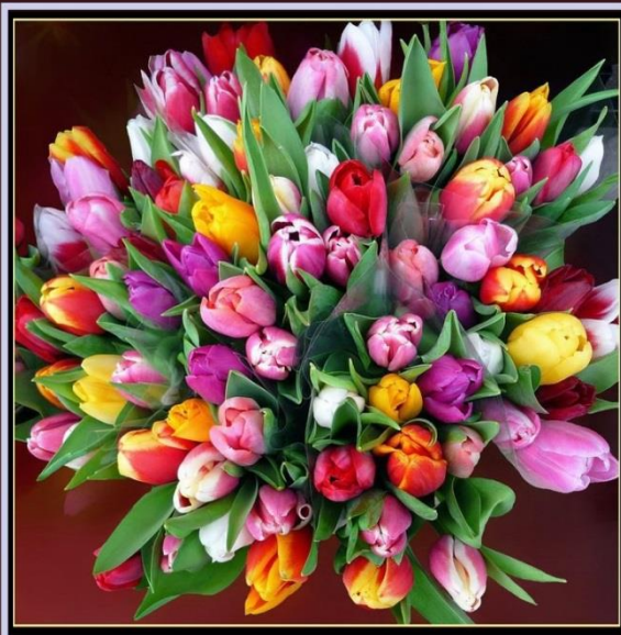
لیکنه او ټولونه: ارواښاد مرزا علم حمیدي ترتیب کوونکی: انجنیر عبدالقادر مسعود