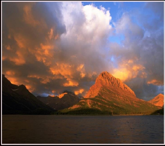
ليکنه او ټولونه: ميرزا علم حميدي ترتيب کوونکی: انجنير عبدالقادر مسعود